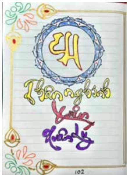
Xuân Lý Houston 04/2022