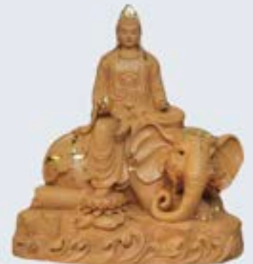
Bồ Tát Phổ Hiền Samantabhadra Bodhisattva