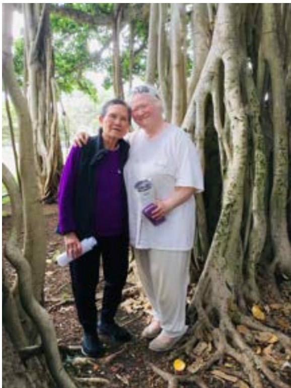
Loan Du Dallas 04/2022

Nhìn biển trời bao la, núi đồi hùng vĩ. Đại Bi Quán Âm tưới nước cam lồ. Đại Hạnh Phổ Hiền soi sáng đường tu. Chứng minh lòng thành của tất cả chúng sinh. Lòng cảm thấy thanh thản và thông thoáng.