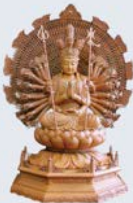
Bồ Tát Quán Thế Âm với ngàn tay, ngàn mắt Quan Yin with Thousand Hands and Eyes