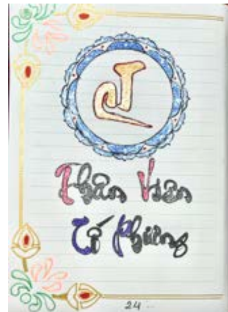
Tố Phương Dallas 04/2022